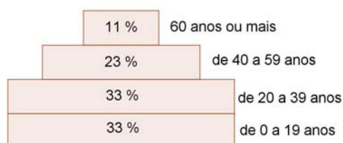
Fig. 2 – Pirâmide etária da população brasileira em 2010 em porcentagem da população.

Considerando que cada retângulo da pirâmide tem 1 cm de altura e cada 1 % da população corresponde a 0,1 cm da base, assinale o que for correto .