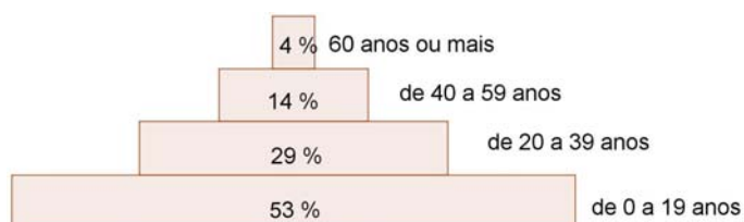
Fig. 1 – Pirâmide etária da população brasileira em 1960 em porcentagem da população.

Segundo o IBGE, a população brasileira, em 1960, era de 70 milhões de habitantes e passou para 190 milhões no ano de 2010. A distribuição por faixa etária da população nesses anos está representada nas pirâmides etárias abaixo.