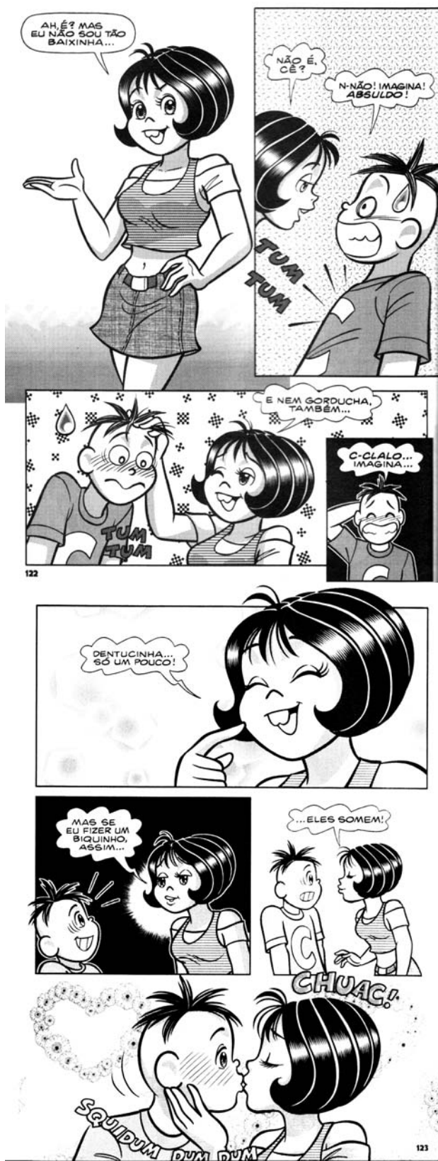
(Turma da Mônica Jovem. ed. 4, novembro/2008, p. 122-123).