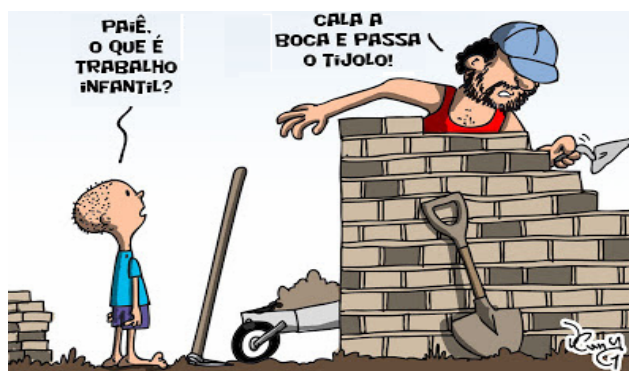
Charge 2.