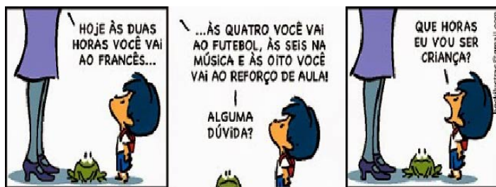
Charge 1. Disponível em falandodelazererecreacao.blogspot.com/2015/10/para-reflet... Acesso em 30 mai 2019.

Esporte, lazer e cultura constam como direitos no Estatuto da Criança e do Adolescente (ECA). Apesar disso, é comum observarmos cotidianamente ações de desrespeito a esses direitos. Sobre o assunto e com base nas charges a seguir, assinale o que for correto .